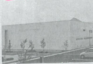
完成した山陽精工の工場

大月市七保町下和田の旧市立下和田小学校跡地に、医療機器などの精密機器メーカー「山陽精工」(大月市)の工場が完成し、18日、落成式が行われた。近く稼働を始める予定。工場は大月市が誘致したもので、約7000平方メートルの敷地に工場棟と管理棟が